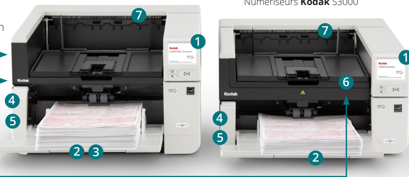
Numériseurs Kodak S3000