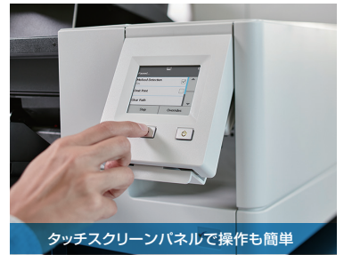
タッチスクリーンパネルで操作も簡単